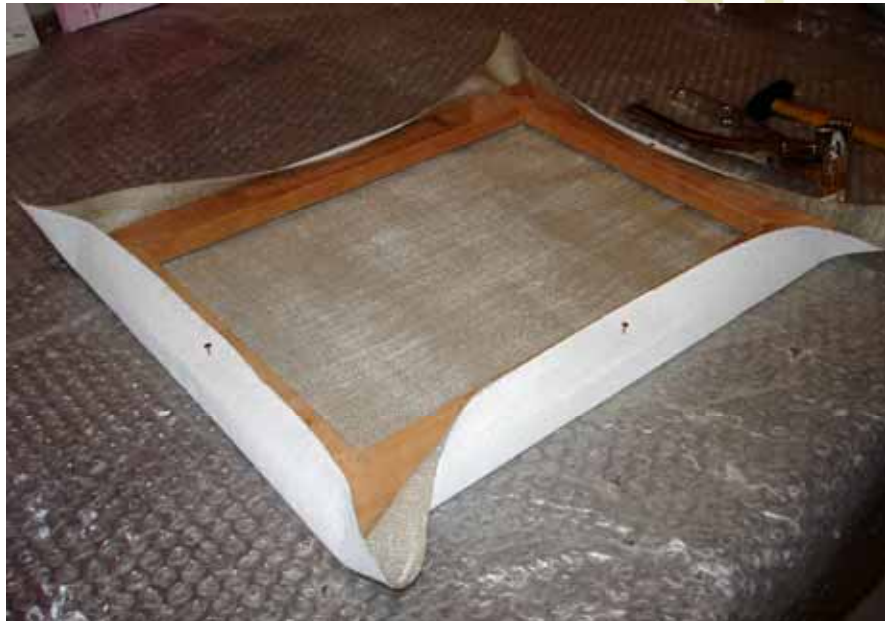
Figura 6: Esticamento preliminar

sem batê-lo até o final (uso pequenos pregos de cobre). Este esticamento, não muito intenso, é só para acomodar o tecido. Depois, vou retirando cada um dos pregos e fazendo o esticamento definitivo, um pouco de cada lado (o lado seguinte ao primeiro deve ser sempre o lado oposto), do centro para as extremidades. A Figura 7 mostra o início deste processo.