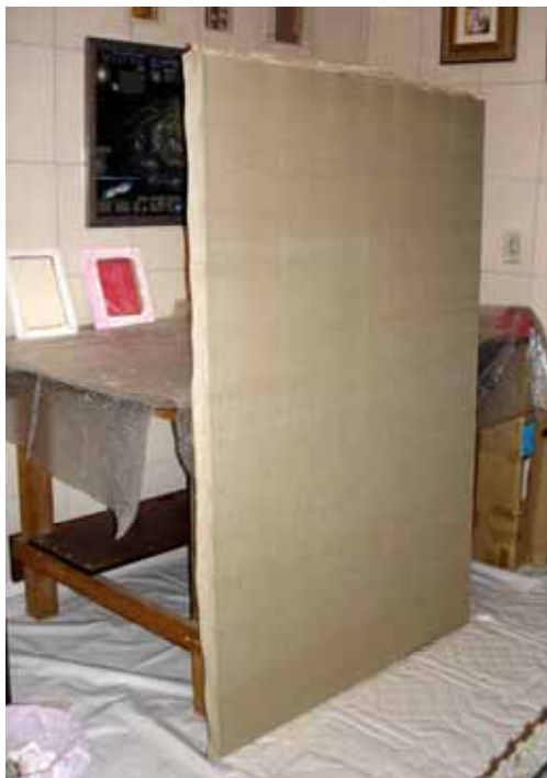
Figura 3: Tecido esticado (não muito)