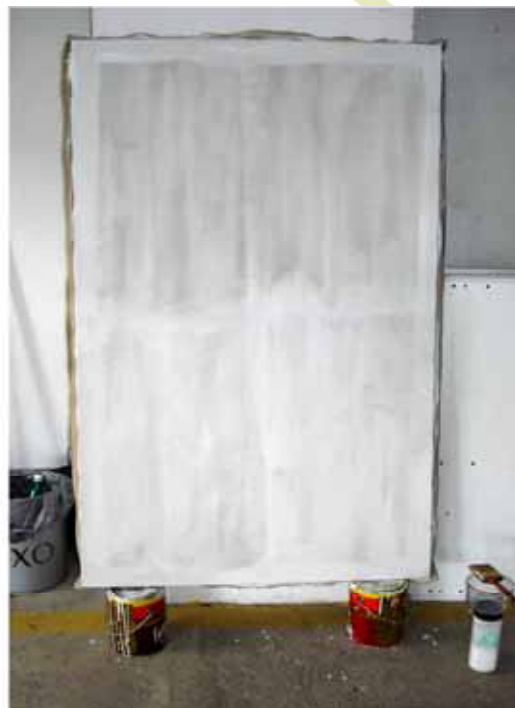
Figura 4: Aplicação de uma demão preliminar

Neste ponto, pode parecer que estou sendo incoerente. Estou usando a mesma tinta de parede que vinha criticando anteriormente e procedendo da mesma forma de quando comprava telas prontas e as melhorava com gesso acrílico. Assim, antes de prosseguir, acho oportuno fazer algumas observações.