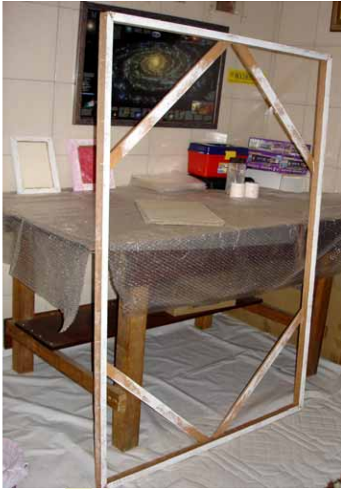
Figura 1: Fotografia de um dos suportes onde estico o tecido.