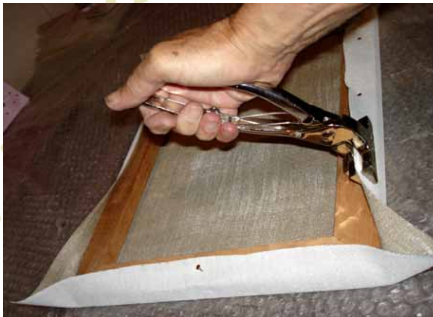
Figura 7: O esticamento definitivo é do centro para as extremidades, um pouco de cada lado.