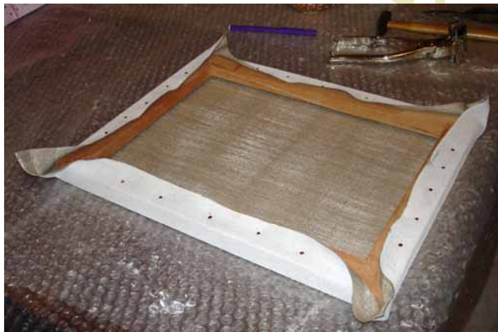
Figura 8: Só falta esticar os extremos.

Na Figura 8 está faltando só esticar os extremos, o que está feito na Figura 9. Um detalhe do extremo é apresentado na Figura 10. Sobre esta tela esticada fazemos a selagem final com a solução de resina vinílica e, após ela secar, aplicamos uma demão de gesso acrílico. Se achar que há necessidade de outra demão, fazer novamente a selagem.