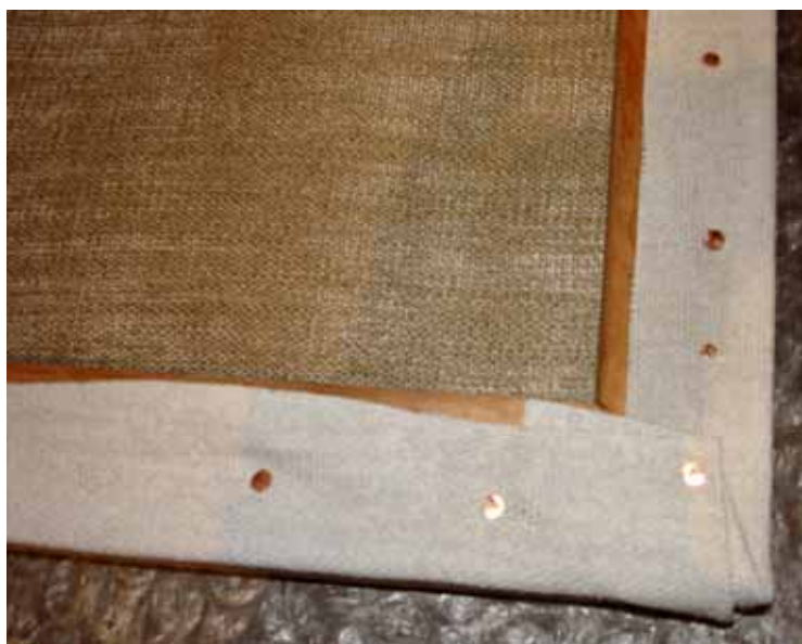
Figura 10: Detalhe do esticamento de um dos extremos

Quando a superfície fica seca, uso uma lixa de forma suave para diminuir um pouco a aspereza, mas não muito a ponto de perder o “dente”. Sem dúvida alguma, o resultado final é uma tela de excelente qualidade!