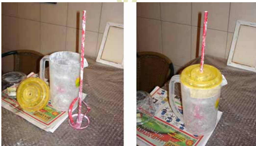
Figura 11: Uso do misturador

Procuo deixar a mistura bem espessa (parecida com as tintas comerciais), pois fica fácil de ser acondicionada em pequenos volumes para uso posterior. Quando vou usar sobre o tecido, esticado como na Figura 3, separo uma parte dessa mistura e a diluo bastante, usando aquela mesma solução da selagem (30% de cola e 70% de água). Como a quantidade de pigmento é grande, às vezes uma só demão já é suficiente para cobrir o tecido. Mas se isso não acontecer, não hesito em dar duas demãos.