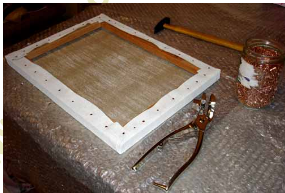
Figura 9: Esticamento completo